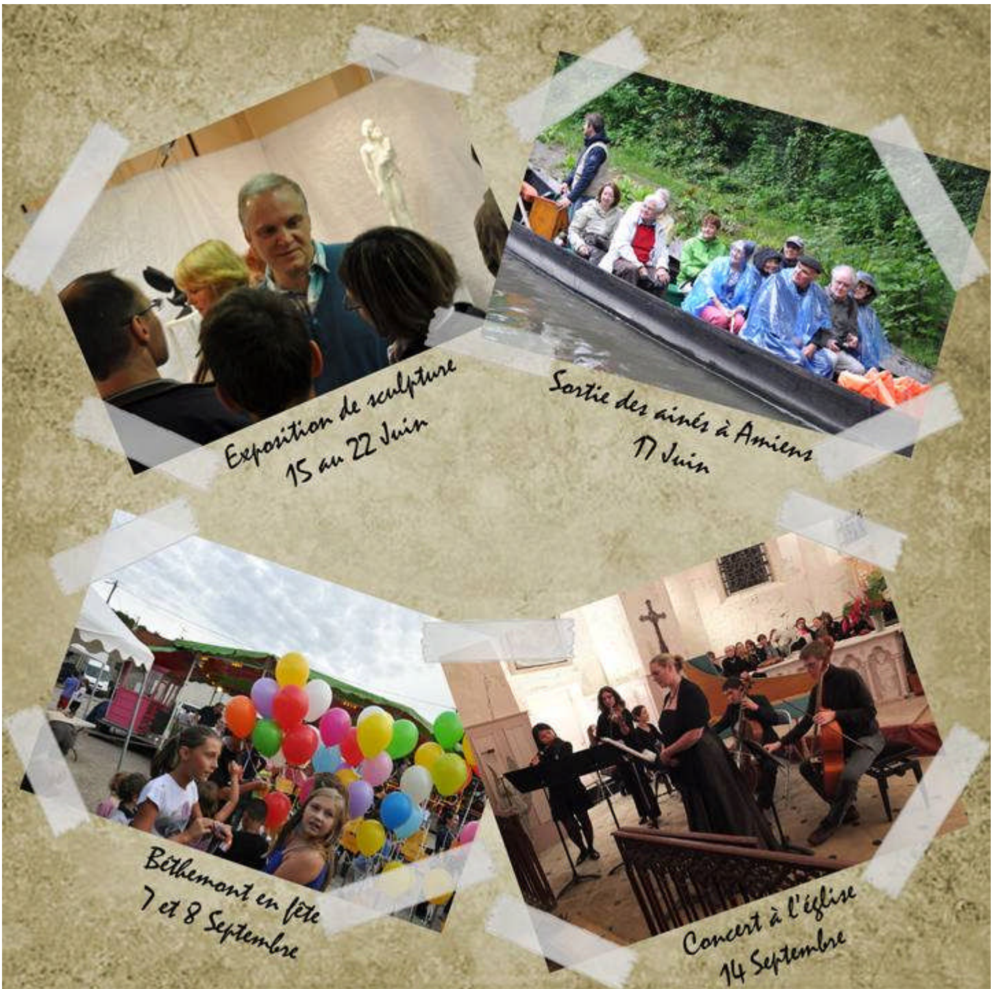
Exposition de sculpture 15 au 22 Juin