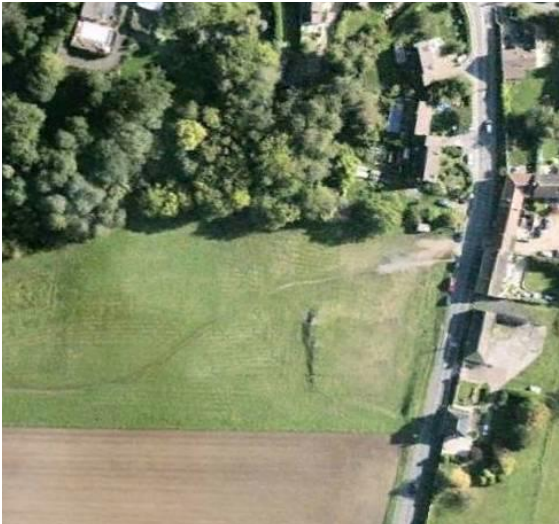
Etat actuel du terrain