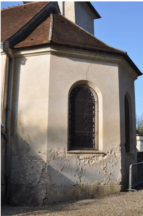
Restauration de l'église Notre Dame de la Pitié (1 ère tranche) Montant total HT : 53 000.00€