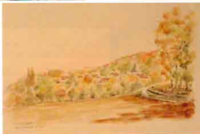
Paysage de Béthemont-la-Forêt peint par Gilles LAMARRE et offert à la Mairie